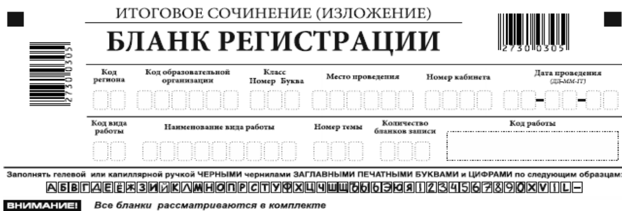
Рис. 2. Верхняя часть бланка регистрации

В верхней части бланка регистрации (рис. 2) расположены: вертикальный и горизонтальный штрих-коды; поля для рукописного занесения информации; строка с образцами написания символов.