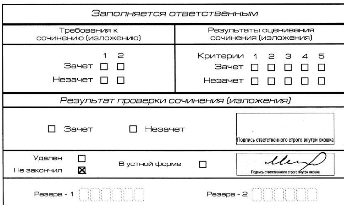
Рис. 12. Заполнение полей нижней части бланка регистрации (завершение написания сочинения (изложения) по уважительным причинам)

В случае если участник итогового сочинения (изложения) по состоянию здоровья или другим объективным причинам не может завершить написание итогового сочинения (изложения), он может покинуть место проведения итогового сочинения (изложения). Члены комиссии по проведению итогового сочинения (изложения) составляют «Акт о досрочном завершении написания итогового сочинения (изложения) по уважительным причинам» (форма ИС-08), вносят соответствующую отметку в форму ИС-05 «Ведомость проведения итогового сочинения (изложения) в учебном кабинете ОО (месте проведения)» (участник итогового сочинения (изложения) должен поставить свою подпись в указанной форме). В бланке регистрации указанного участника итогового сочинения (изложения) необходимо внести отметку «Х» в поле «Не закончил» для учета при организации проверки, а также для последующего допуска указанных участников к повторной сдаче итогового сочинения (изложения) в дополнительные сроки. Внесение отметки в поле «Не закончил» подтверждается подписью члена комиссии по проведению итогового сочинения (изложения).