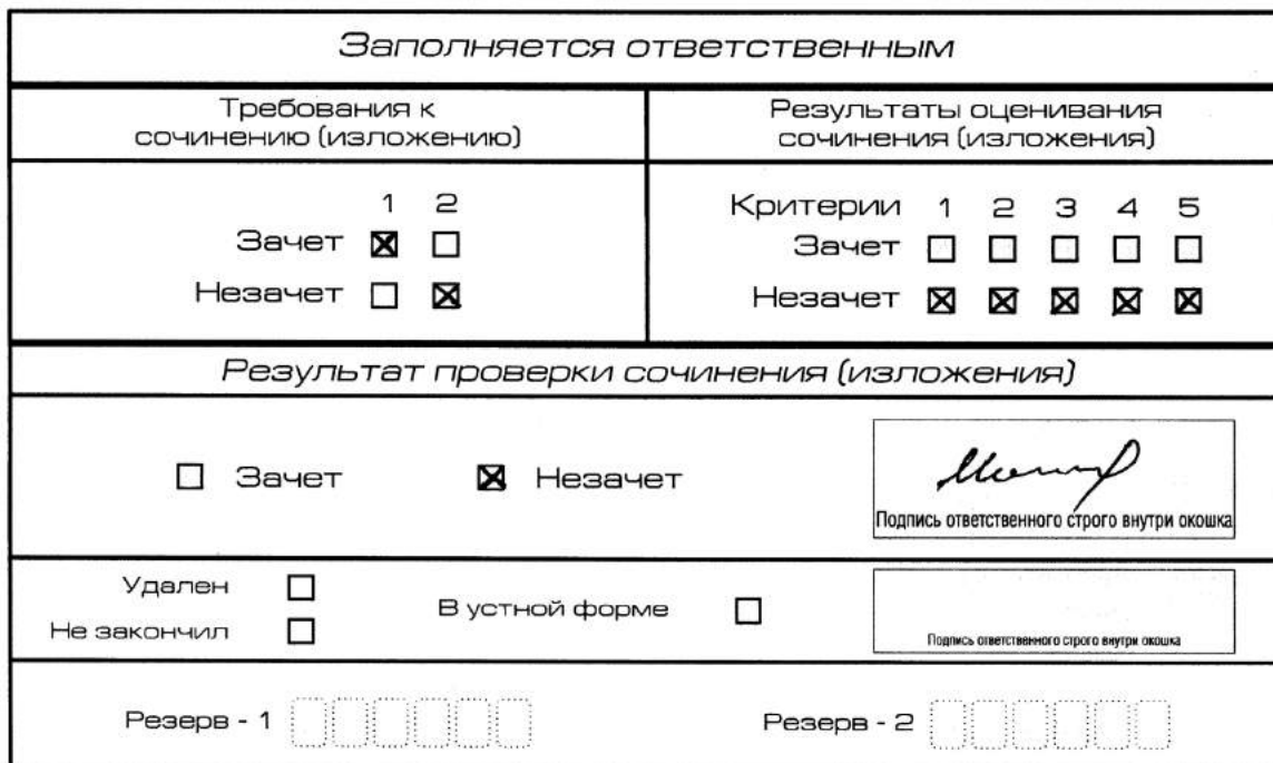
Рис. 9. Область для оценки работы