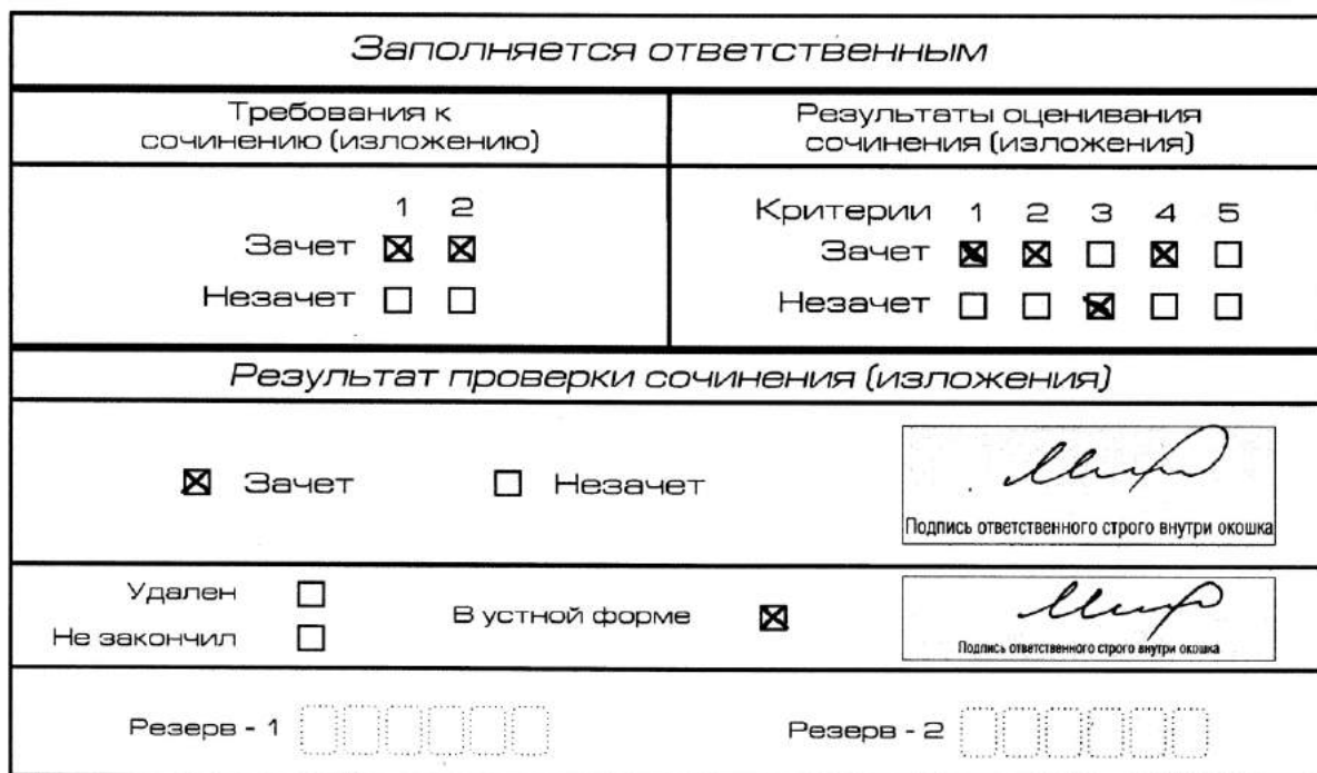
Рис. 11. Область для оценки работы сочинения (изложения) в устной форме

После окончания заполнения бланка регистрации ответственное лицо ставит свою подпись в специально отведенном для этого поле.