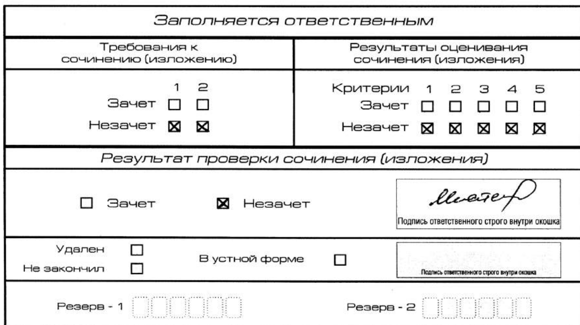
Рис. 8. Область для оценки работы

Выставляется «незачет» за невыполнение требования № 2. В клетки по всем критериям оценивания выставляется «незачет». В поле «Результат проверки сочинения (изложения)» ставится «незачет» (см. рис. 9).